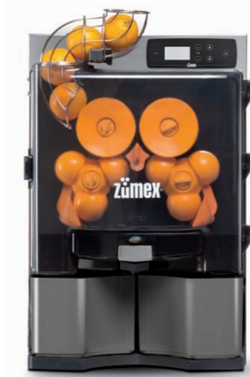
Zumex Essential Graphite