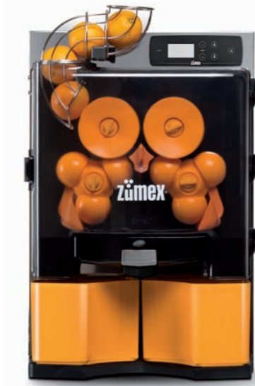
Zumex Essential Orange