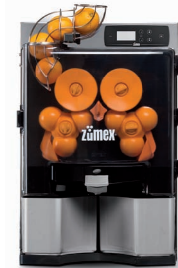
Zumex Essential Silver