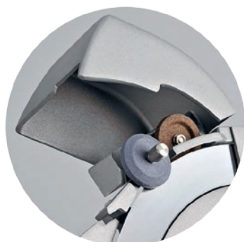
Schleifvorrichtung Aigiseur de couteaux