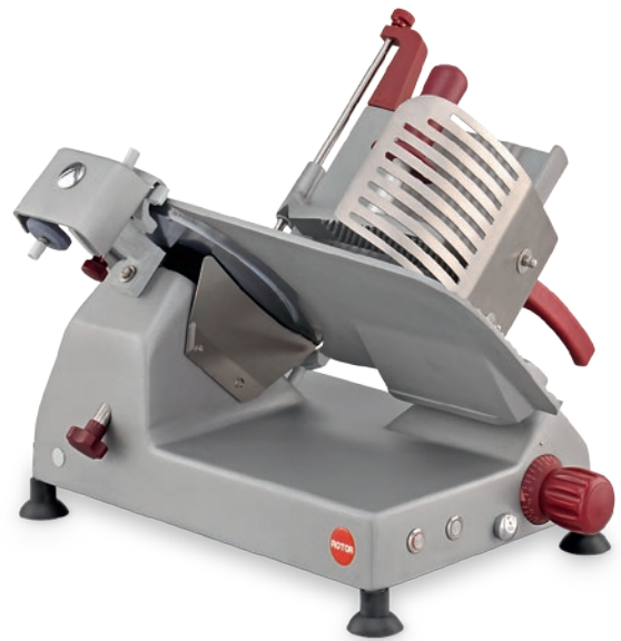
ASC Schrägschnitt • ASC coupe inclinée

Die Maschinen verfügen über eine aufsteckbare Vorrichtung, mit der sich das scharfe Messer zur Reinigung ohne Werkzeug und ohne Verletzungsgefahr leicht entfernen lässt.