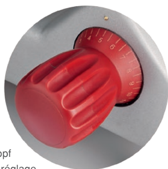
Verstellknopf Bouton de réglage