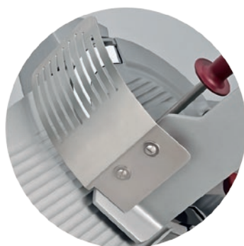
Handschutz aus Edelstahl Protection des mains en acier inoxydable