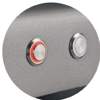
Ein-Ausschalter mit LED Interrupteur marche/arrêt avec LED