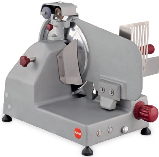
AGC Gradschnitt • AGC coupe droite