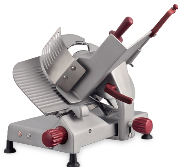
Typ ASC Type ASC