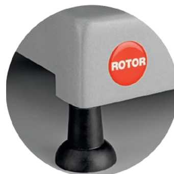
Weiche, rutschfeste Gummifüße Pieds en caoutchouc doux et antidérapant