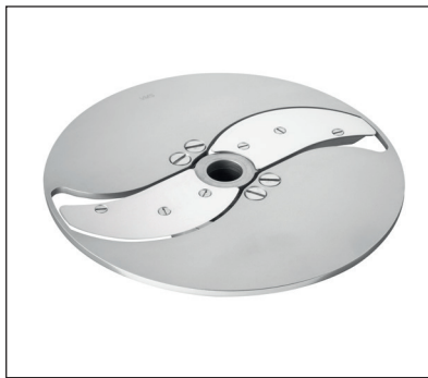
Verstellbare Scheibenschneidscheibe 0 – 8 mm mit ziehendem Schnitt