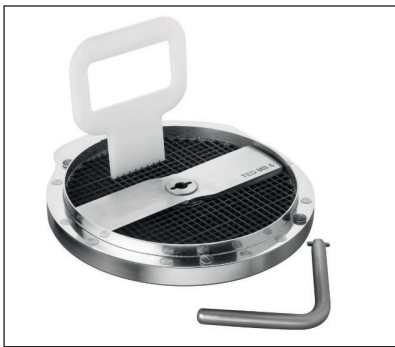
Würfeleinsatz mit Messer, Reinigungsstopfer und Messer-Entnahmewerkzeug

Die Scheibenschneidscheiben und Würfelmesser verfügen über zwei Klingen.