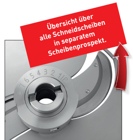
Einfaches Einstellen der Schnittdicke ohne Werkzeug.