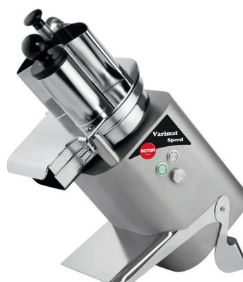
Gemüseschneider Rotor Varimat Speed Gourmet mit variabler Drehzahl

Für noch höhere Ansprüche an Leistung und Universalität haben wir eine ebenso kompakte Alternative: