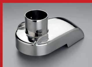
Deckel aus hochglanzpoliertem Edelstahl mit grossem 80 mm Rundschacht, für hohe Leistung