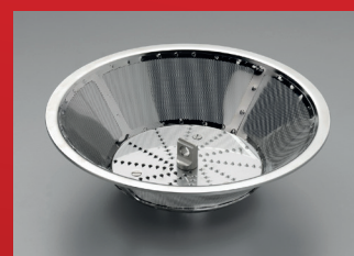
Robuster Schleuderkorb komplett aus Edelstahl mit auswechselbarer Reisscheibe