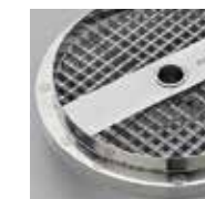
Tagliare a cubetti