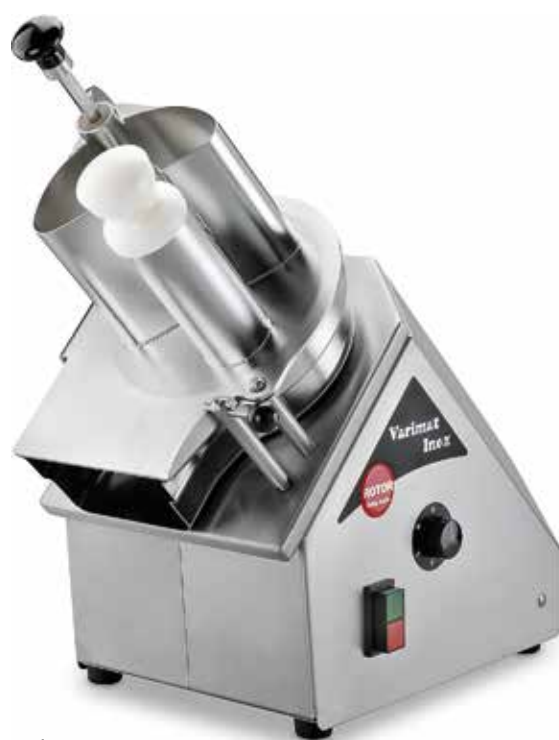
Rotor Varimat Inox