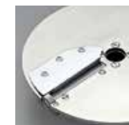
Taglio alla julienne

Le basse forze di taglio ottenute grazie alla geometria e alla qualità dei coltelli permettono una produzione maggiore e tagli migliori. Inoltre è possibile regolare il numero di giri alla velocità ottimale con estrema semplicità.