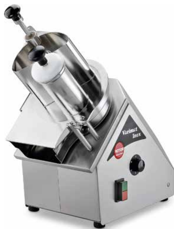
Rotor Varimat Inox Gourmet