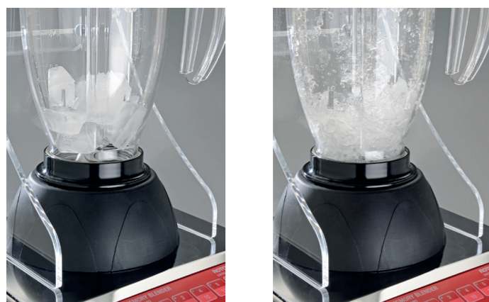
avant le broyage

Le Memory Blender 2 est plus compacte, programmable, parfait pour les professionnels. Le couteau est entraîné directement par un moteur très puissant, résistant à haute température et est pourvu d'un ventilateur. La construction et les cycles de vitesses réglés électroniquement garantissent un maximum de rendement. Les couteaux à haut rendement réduisent en quelques secondes les cubes de glace en neige.