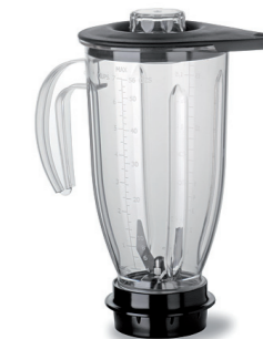
Mélangeur 2 litres en polycarbonate léger et maniable, transparent, empilable, gradué.