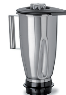
Mélangeur 2 litres en inox, robuste, garantit les grandes exigences en hygiène avec poignée en inox.

Les mélangeurs robustes en acier inoxydable ou polycarbonate résistant aux chocs, sont donc incassables. La tête de coupe est entièrement en acier inoxydable et démontable pour le nettoyage du mélangeur. La tête de coupe possède 2 roulements à bille étanches en acier inoxydable et possède 4 amortisseurs de chocs. Les pièces détachées sont faciles à remplacer.