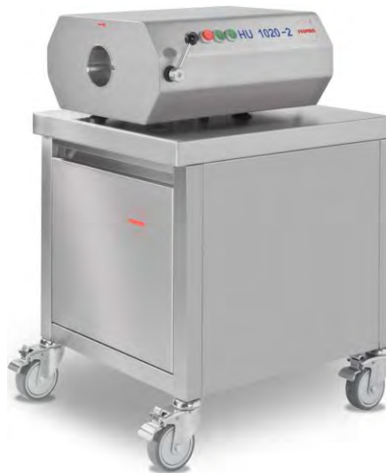
Abb. 10: Beispiel für die Montage der Antriebseinheit auf einem Tisch/Unterschrank